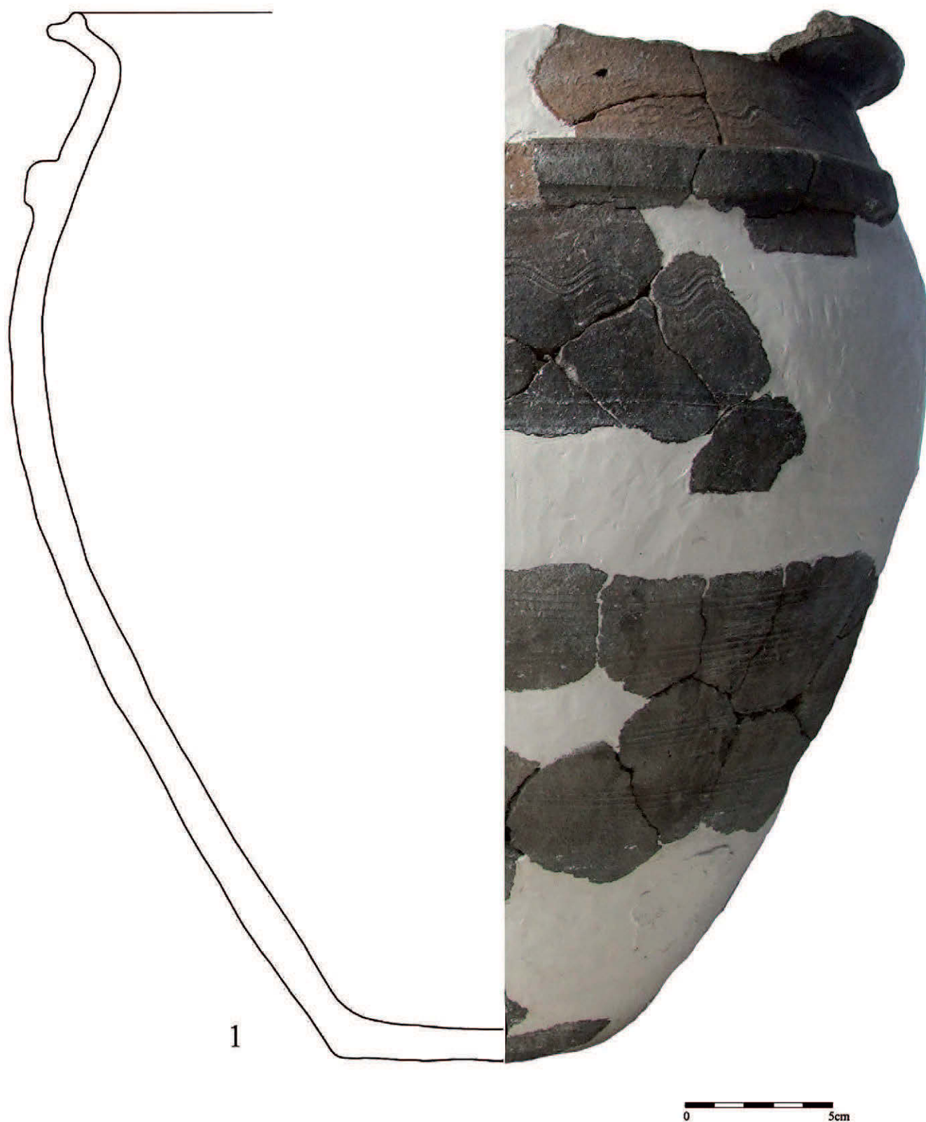
Tab. 53. Mikulčice – Valy, keramika MO. 1. 594-5527/89.