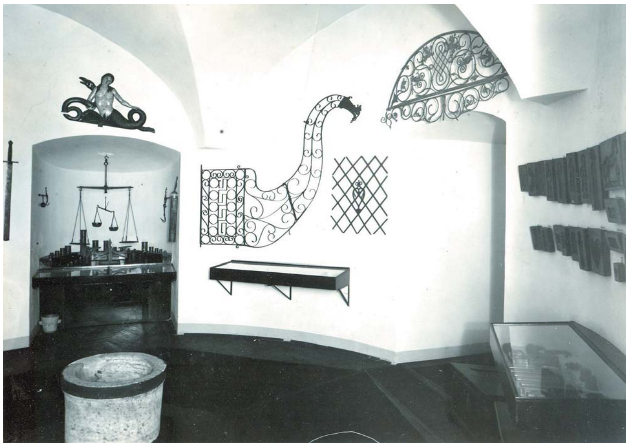
Obr. 2. Popravčí meč města Mostu prezentovaný v expozici umístěné ve věži přerovského zámku ve 30. letech 20. století. Předmět je připevněn na zdi při levém okraji snímku