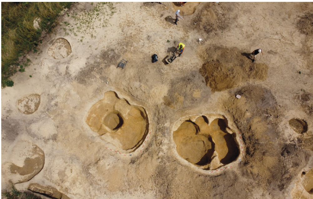
Obr. 10. Měřovice nad Hanou. Pohled na rozměrné exploatační objekty ze závěru doby římské.

Fig. 9. Měřovice nad Hanou. Small sunken hut with a typical six-post construction.