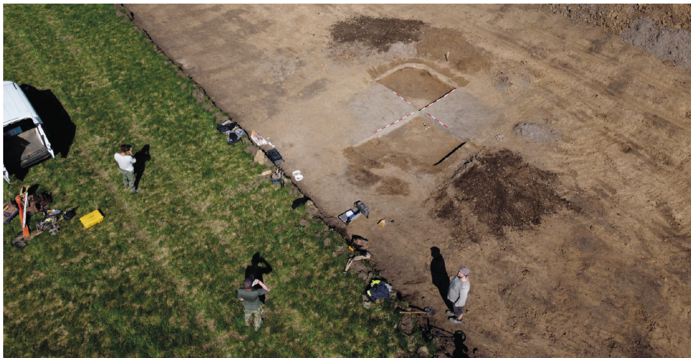
Obr 13. Víceměřice. Pracovní snímek z průběhu výzkumu.