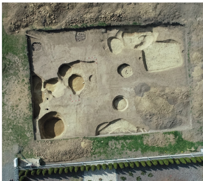
Obr. 11. Opava. Pohled na zkoumanou plochu z dronu.