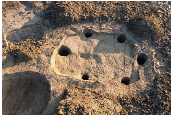
Obr. 9. Měřovice nad Hanou. Půdorys drobné zemnice s typickou šestikúlovou konstrukcí.

Fig. 8. Měřovice nad Hanou. Pottery kiln No. 1 with its preserved service area – a sunken hut.