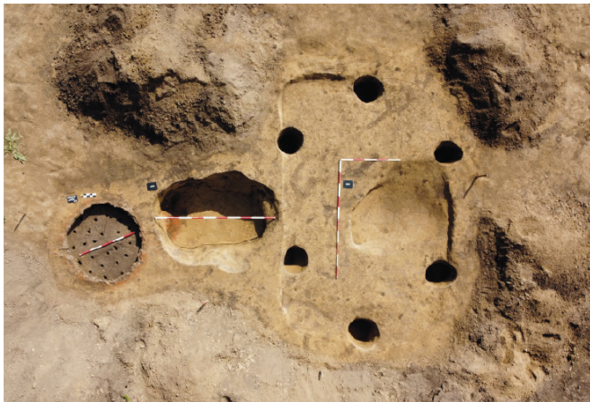
Obr. 8. Měřovice nad Hanou. Keramická pec č. 1 s dochovaným zázemím obsluhy – zahluobenou chatou.

Fig. 8. Měřovice nad Hanou. Pottery kiln No. 1 with its preserved service area – a sunken hut.