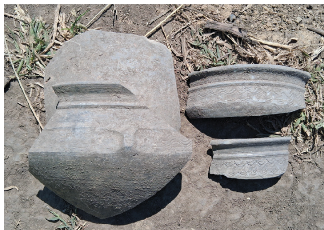
Obr. 6. Měrovice nad Hanou. Keramika z výplně pece č. 1, včetně zlomku s atypickým pyramidálním výčnělkem.

Výrazným prvkem výrobního areálu jsou dvě výjimečně dobře zachovalé vertikální dvoukomorové keramické pece typu B, v jednom případě s neporušeným roštem (obr. 8). Ve výplních pecí byl doložen početný soubor „jiříkovické“ keramiky. K jedné z pecí přiléhá patrně výrobní zázemí v podobě polozahloubené chaty