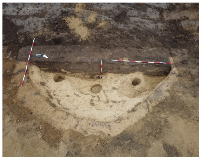
Obr. 1. Brno – ulice Štefánikova, Staňkova. Chata z doby římské narušená novodobou strukturou.

Odkryv v areálu stavby bude pokračovat i v roce 2026. Materiál získaný výzkumem je v tuto chvíli ve fázi zpracování.