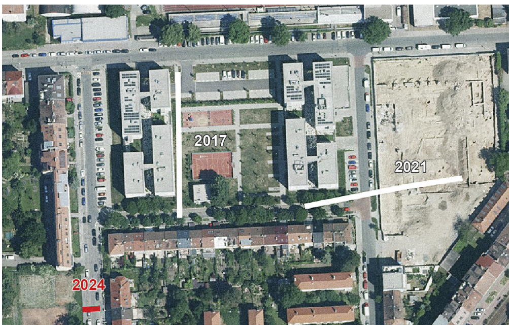
Obr. 3. Brno – Havlenova ulice. Příkopy římských pochodových táborů zjištěné archeologicky v letech 2017, 2020, 2021 (bílé) a výzkumem v roce 2024 (červené).