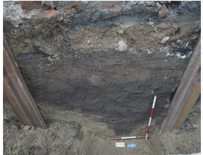
Obr. 2. Brno – Havlenova ulice. Příkop s. j. 515 zachycený v západní stěně původního výkopu teplovodu.

Grünseisen, J., Kolařík, V., Sedláčková, L. 2021: Brno (k. ú. Štýřice, okr. Brno-město). Přehled výzkumů 62(1) , 287–290.