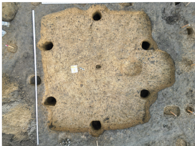
Obr. 4. Kojetín. Jedna z prozkoumaných germánských zemnic. Fig. 4. Kojetín. One of the excavated Germanic semi-sunken huts.

Ze starších povrchových sběrů byla známa přítomnost sídliště z doby římské, mimo jiné i na základě nálezů zlomku terra sigillata (Droberjar 1991). Výzkumem bylo odhaleno celkem pět zemnic s typickou konstrukcí sestávající ze šesti kúlů vymezujících přibližně pravidelný půdorys. Ve dvou případech šlo o stavby o délce strany kolem 4,5 m, u jedné i s vchodovým výklenkem v jižní stěně (obr. 4, 5). Kromě běžné sídlištní germánské keramiky byly nalezeny i zlomky importovaných nádob římské provenience. Vzhledem k množství prozkoumaných objektů a získaných nálezů bude možné bližší vztahy k ostatním objektům na lokalitě s jistotou určit až po laboratorním zpracování.