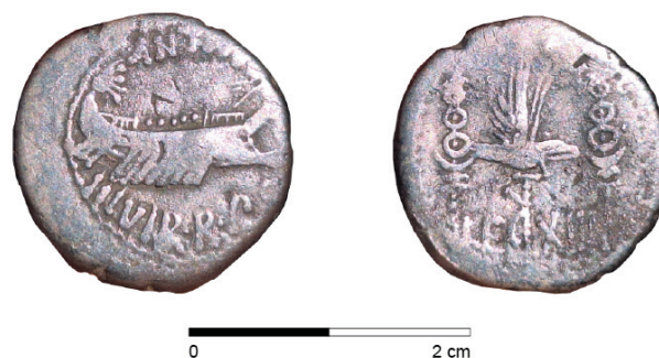
Obr. 12. Přerov. Stříbrný denár Marca Antonia.

Pozdně republikánské denáry typu RRC č. 544/14–39 jsou nacházeny jak jednotlivě, tak coby součást hromadných nálezů v Čechách i na Moravě. Na Přerovsku pochází dva exempláře denáru typu RRC č. 544/13–39 z depotu Dřevohostice, který byl do země ukryt po roce 4 n. l. (Militký, Jarůšková 2024, 13).