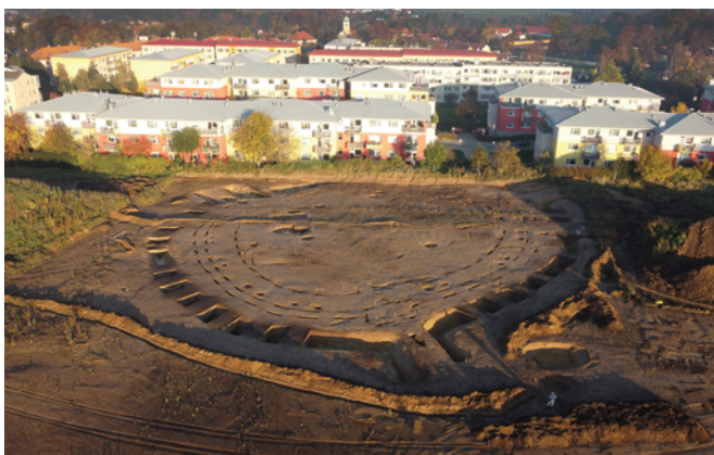
Obr. 1. Plocha zkoumaného neolitického rondelu v Praze-Vinoři v kontextu stávající zástavby.

Jak si tedy stojí akce Archeologické léto po čtyřech letech své existence? Od roku 2020 stoupá každý rok počet nabízených lokalit a také institucí, které se chtějí do celorepublikové akce zapojit. Zdá se, že počet lokalit se nyní stabilizoval kolem čísla 100 pro celou ČR. V druhém a třetím roce jsme nabídli poměrně vyšší množství komentovaných prohlídek, což ovšem vedlo jen k nepatrnému zvýšení zájmu veřejnosti. Rostoucí číslo přímých rezervací koresponduje také s každoročním zvýšením počtu návštěvníků webových stránek z unikátních IP adres (pro konkrétní údaje viz Kosarová, Mařík 2020; Kosarová et al. 2021, 271; 2022, 192). Pro koordinátory akce byl překvapivě výrazný nárůst počtu rezervací právě v poslední, čtvrté sezoně (graf 1, 2), ačkoliv jsme nabídli o téměř 50 termínů prohlídek méně. Ukazuje se tak, že se zájemci z řad veřejnosti lze z časového hlediska pracovat mnohem efektivněji k prospěchu obou stran (menší časová náročnost pro archeology a početnější skupinky v terénu). Lze se pouze dohadovat, zda zapůsobily nové přehlednější stránky, nebo cílenější propagace na sociálních sítích; nejspíše kombinace obou faktorů.