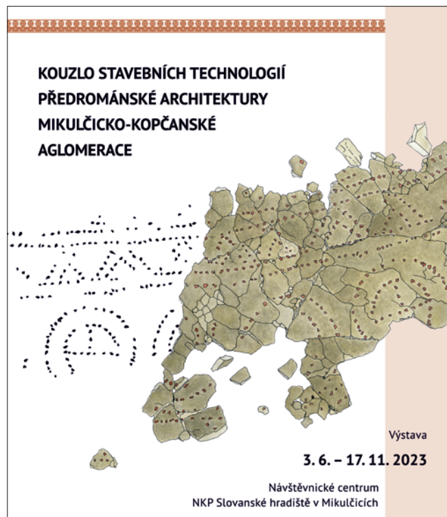
Obr. 1. Výřez plakátu výstavy s motivem imitace mozaiky na podlaze 9. kostela v Mikulčicích. Kresba M. Housková, grafika A. Poláčková.

Z věcných témat pojednaných na výstavě jmenujme alespoň některé. První z nich se týká dochování zděných staveb: na rozdíl od Mikulčic, kde reliktů v podstatě všech staveb mají podobu pouhého otisku – tzv. „negativu“ – základového zdiva, kostel sv. Markéty Antiochijské v Kopčanech se dochoval v plné hmotě obvodového zdiva a klenby presbytáře, jež dovoluje doplnit naše znalosti velkomoravské zděné architektury o řadu detailních zjištění. Druhým vybraným tématem může být hodnocení funkce zděných staveb, kde vystupují zejména dva výjimečné objekty – 3. kostel neboli bazilika a halová stavba, označovaná tradičně jako „palác“. Obě stavby reprezentují nejvyšší ambice soudobé moravské architektury a dovolují uvažovat o jejich spojení s panovnickou mocí, v případě baziliky pak s pravděpodobnou funkcí biskupského, eventuálně klášterního kostela. Třetí vybrané téma reprezentují dřevěné prvky použité ve zděných