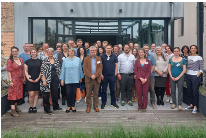
Obr. 1. Závěrečné setkání projektu Saving European Archaeology from the Digital Dark Age na půdě Archeologického ústavu AV ČR, Brno, v. v. i.

Fig. 1. Final meeting of the Saving European Archaeology from the Digital Dark Age project at the Institute of Archaeology of the Czech Academy of Sciences, Brno.