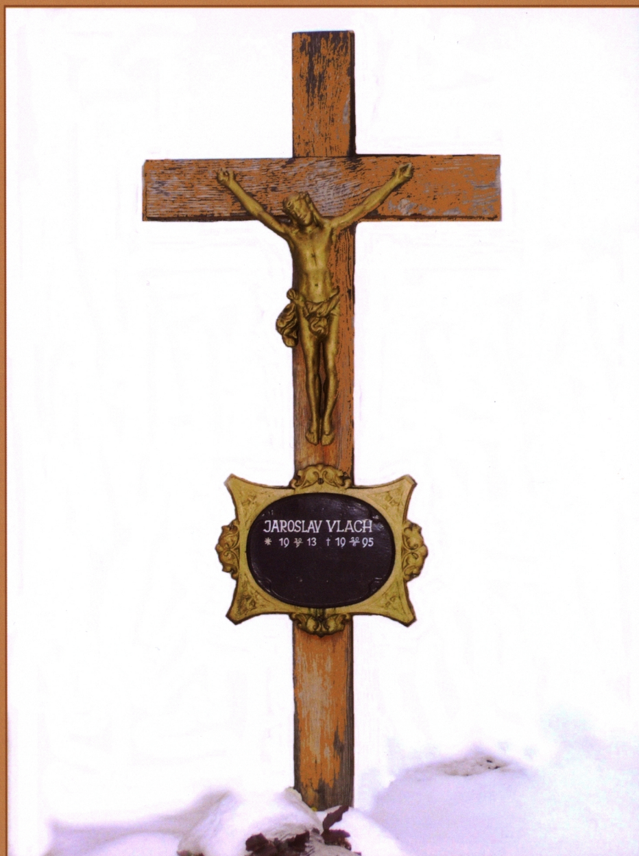
Kříž na Vlachově hrobě, Foto: Jaroslav Hroudný

HISTORICKO-VLASTIVĚDNÉHO KROUŽKU V ŽAROŠICÍCH 2010