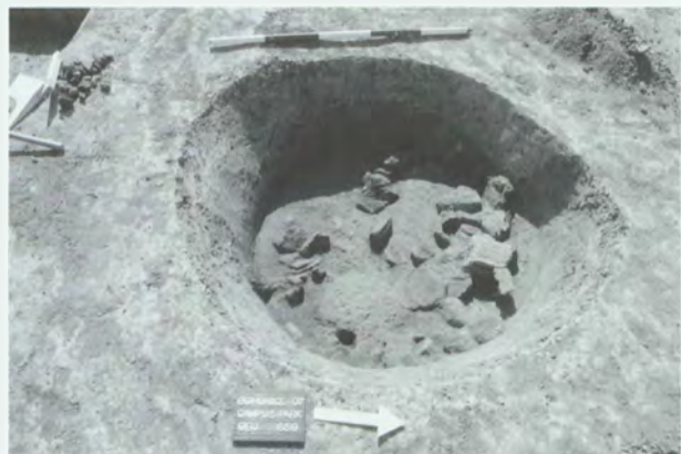
Obr. 1: Brno-Bohunice, Nový a Starý Lískovec. „Dolní rybníčky“ a „Klíny“. Jevišovická jáma s bloky mazanice. Abb. 1: Brno-Bohunice, Nový und Starý Lískovec. „Dolní rybníčky“ u. „Klíny“. Jevišovicer Grube mit den Hüttenlehmblöcken.