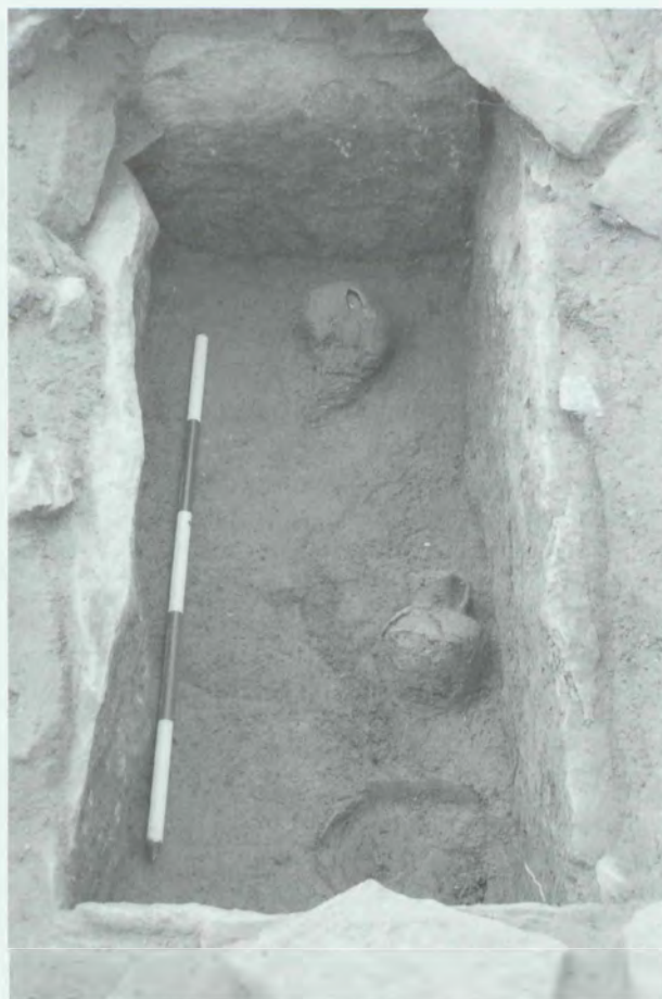
Obr. 5: Slatinky-Hradisko u Varhan. Skříňkový hrob (KNP). Abb. 5: Slatinky-Hradisko u Varhan. Steinkistengrab (Trichterbecherkultur)

Náhodně objevený a zdokumentovaný skříňkový hrob (obr. 5) se nacházel v prostoru mezi mohylami na jižní