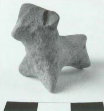
Obr. 2: Křenovice-Vinice. Drobná zoomorfní plastika jevišovické kultury. Abb. 2: Křenovice-Vinice. Kleine Tierplastik der Jevišovicer Kultur.

Křenovice (Bez. Přerov). „Vinice“ (Křenovice 2). Mährische bemalte Keramik u. Jevišovicer Kultur. Siedlung. Rettungsgrabung.