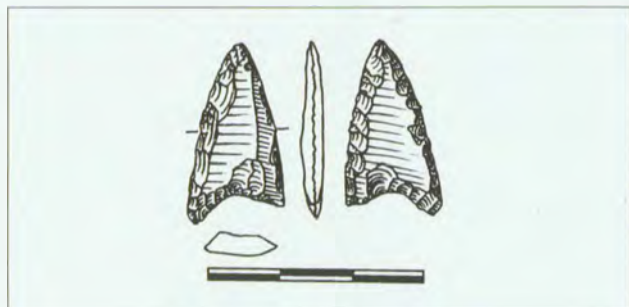
Obr. 6: Spytihněv. Šipka. Abb. 6: Spytihněv. Pfeilspitze.