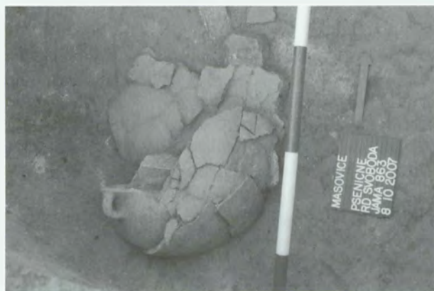
Obr. 3: Mašovice-Pšeničné. Dvouchá nádoba v jámě 863 (KNP). Abb. 3: Mašovice-Pšeničné. Zweihenkeliges Gefäß in der Grube 863 (Trichterbecherkultur)

Mašovice (Bez. Znojmo). „Pšeničné“. Trichterbecherkultur (Phase Ia). Siedlung. Rettungsgrabung.