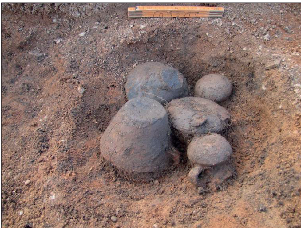
Obr. 2. Hvozdnice (okr. Hradec Králové) – hrob 20B v průběhu preparace.