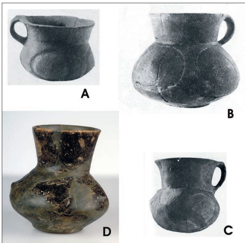
Obr. 5. Vybrané paralely keramiky s odsazenými vypnulínami: A – Libochovany (okr. Litoměřice), džbánek z hrobu 68a (PLESL 1961, tab. I:10); B – Ústí nad Labem-Střekov, pohřebiště Střekov I, džbánek z hrobu u čp. 5 (PLESL 1961, tab. XXI:6); C – Brandýs nad Labem-Stará Boleslav (okr. Praha-východ), lázně Houštka, džbánek z mohyly 1 (PLESL 1965, obr. 12:1); Turnov (okr. Semily), Sobotecká ul., býv. Maškovo zahradnictví, džbánek z objektu 1638/01 (BLÁHOVÁ – PROSTŘEDNÍK 2007, obr. 13).