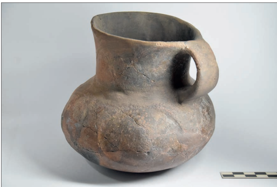
Obr. 3. Hvozdnice (okr. Hradec Králové). Nádoba II z hrobu 20B.