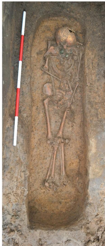
Kresebná a fotografická dokumentace hrobu „vinořské princezny“ Dokumentace ÚPA a ARÚ Praha