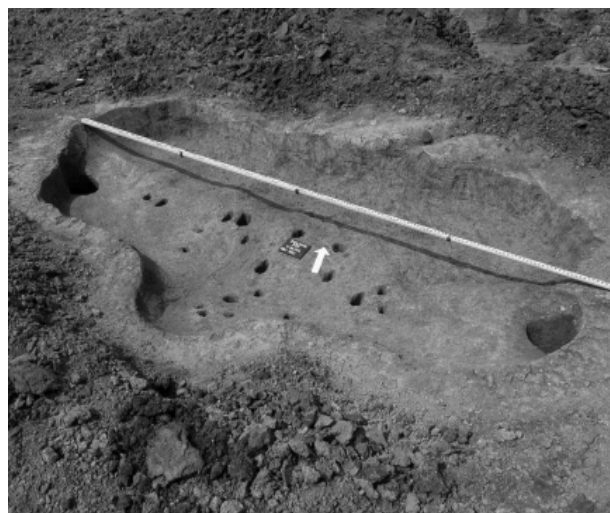
Obr. 3. Laténská zahlobená chata.