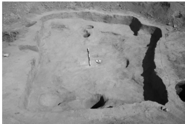
Obr. 5. Polešovice. Latěnská chata.

Podobně jako v minulých letech byl i v roce 2011 proveden na známé polykulturní lokalitě v polešovické pískovně (viz kapitoly Neolit a Doba bronzová) pravidelný záchranný výzkum probíhající v závislosti na postupu těžebních prací. Osídlení lokality v době halštatské se v této etapě výzkumu projevilo u nejméně tří objektů, které můžeme na základě jejich zevní charakteristiky interpretovat jako zásobní jámy. Z dalších významnějších nálezů je třeba zmínit odkrytí jedné zahloubené chaty a jedné zásobní jámy z časně latěnského stupně LT A. U zjištěné chaty obdélného půdorysu orientovaného přibližně ve směru východ-západ, byla pozorována běžná konstrukce v podobě dvou kúlových jamek v kratších stranách a stupňovité zvýšení u delší strany objektu na jižní straně (Obr. 5). Z hmotných předmětů nalezených ve