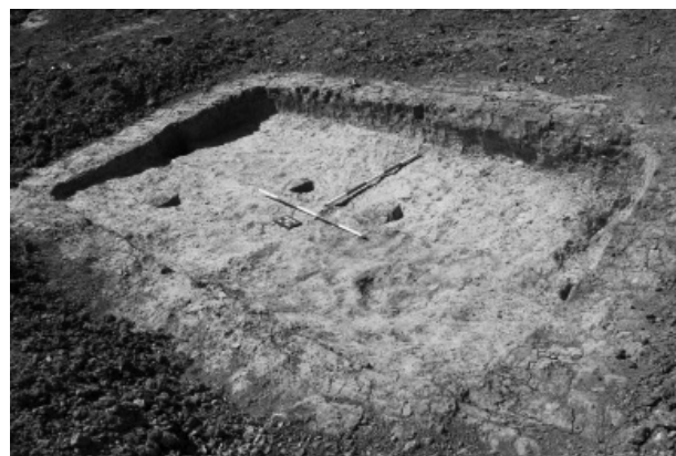
Obr. 6. Zástřizly. Laténská chata.

Během postupujícího výzkumu při rozsáhlé záchrané akci v rámci stavby Lokálního biocentra Záviška bylo zjištěno, že zkoumaná lokalita nebyla osídlena pouze v období raného až vrcholného středověku (viz kapitola Středověk a novověk), ale i v dobách starších. Několik metrů od nivy potoka Prusinovky se na pomyslné vrstevnici v celém zkoumaném prostoru rovnoměrně nacházely čtyři zahloubené laténské chaty typického obdélného tvaru s obvyklou kúlovou konstrukcí v kratších stěnách (Obr. 6). V některých případech byly identifikovány i menší kúlové jámy uvnitř půdorysu jednotlivých objektů. Pátá chata byla silně narušena vrcholně středověkým objektem a rozpoznána byla až dodatečně. Z výplní těchto chat pochází kromě souboru obvyklé keramiky také zlomky nádob opatřených struhadlovitým drsněním, rytou výzdobou a kolky v podobě obráceného C. Ojediněle se vyskytly i zlomky železných spon. V jedné z chat bylo také nalezeno několik mazanicových fragmentů z roštu hrnčírské pece, kterou se však zatím nepodařilo na lokalitě rozpoznat. Všechny tyto nálezy nám umožňují datovat keltské osídlení lokality do střední až pozdní doby laténské.