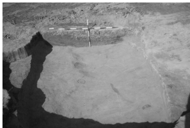
Obr. 4. Mostkovice. Zemnice platěnické kultury.

Výzkumem pozůstatků pravěkého osídlení v poloze „U Vrbiček“ (dnes na dně plumlovské údolní nádrže) na katastru obce Mostkovice, byly získány vůbec první doklady o pravěkém osídlení místa. To bylo na základě