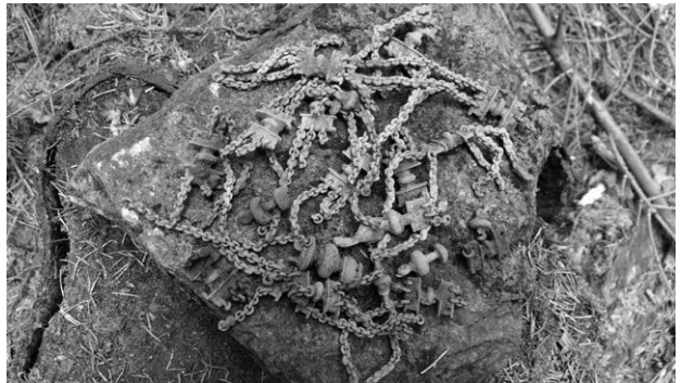
Obr. 3. Hluboké u Kunštátu. Nálezové foto ženského opasku.

Hluboké u Kunštátu (Bez. Blansko), „Spaliska“. Laténezeit. Einzelfund der Gürtelkette. Rettungsgrabung.