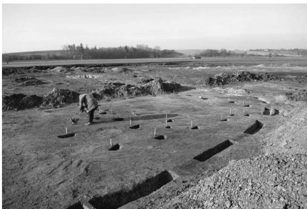
Obr. 7. Kobylnice, „Rybníky“ (okr. Brno-venkov). Dvorec z doby halštatské.

Kobylnice (Kat. Kobylnice u Brna, Bez. Brno-venkov), „Rybníky“. Hallstattzeit, Laténezeit. Siedlung. Rettungsgrabung.