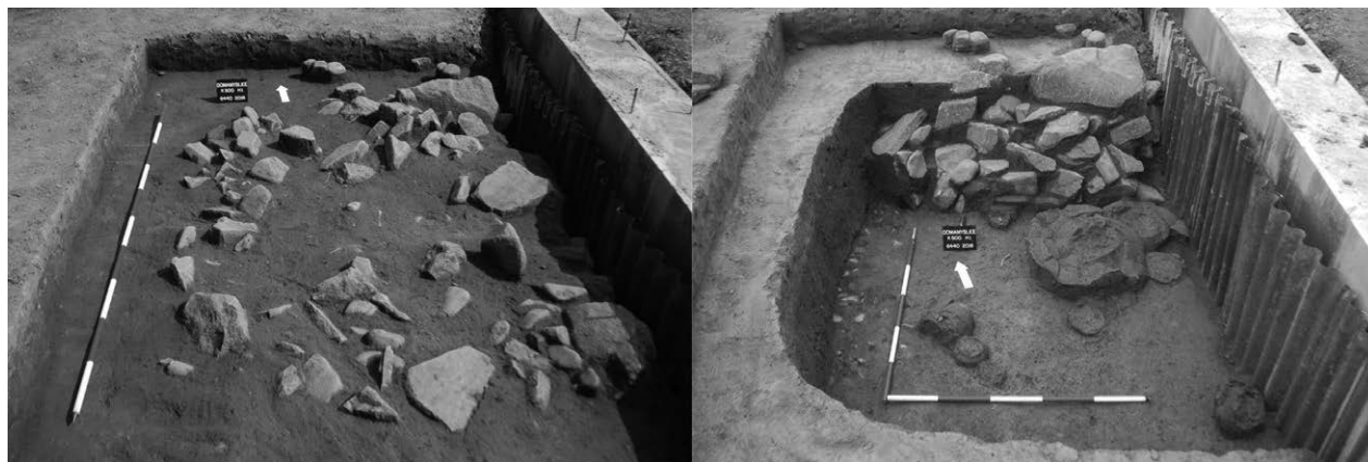
Obr. 8. Prostějov, k. ú. Domamyslice, okr. Prostějov, „V loučkách“. Komorový hrob č. 1/2016.

Přerov (Kat. Lýsky, Bez. Přerov), „Nad struhou“. Latènezeit. Siedlung. Rettungsgrabung.