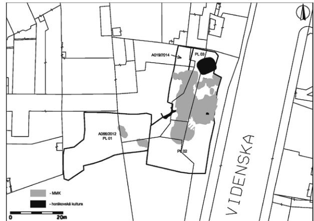
Obr. 2. Vídeňská halštát Brno-Štýřice (akce A066/2012 a A019/2014). Výzkumem zachycené osídlení kultury horákovské.

Brno (Kat. Štýřice, Bez. Brno-město), Vídeňská-Sraže, Parz. Nr. 640/8, 640/17, 652/3, 652/6, 676/1, 678/1, 678/2, 679, 680 (Aktion A066/2012). Hallstattzeit, Horákov Kultur. Siedlung. Rettungsgrabung.