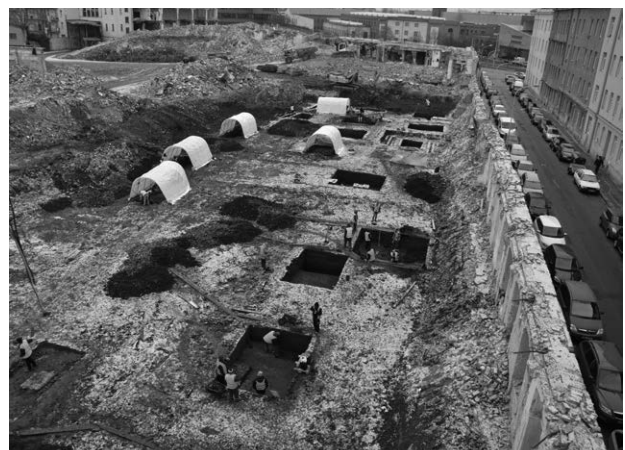
Obr. 1. Brno-Trnita. Areál Vlněny. Pohled na plochu výzkumu od severu.